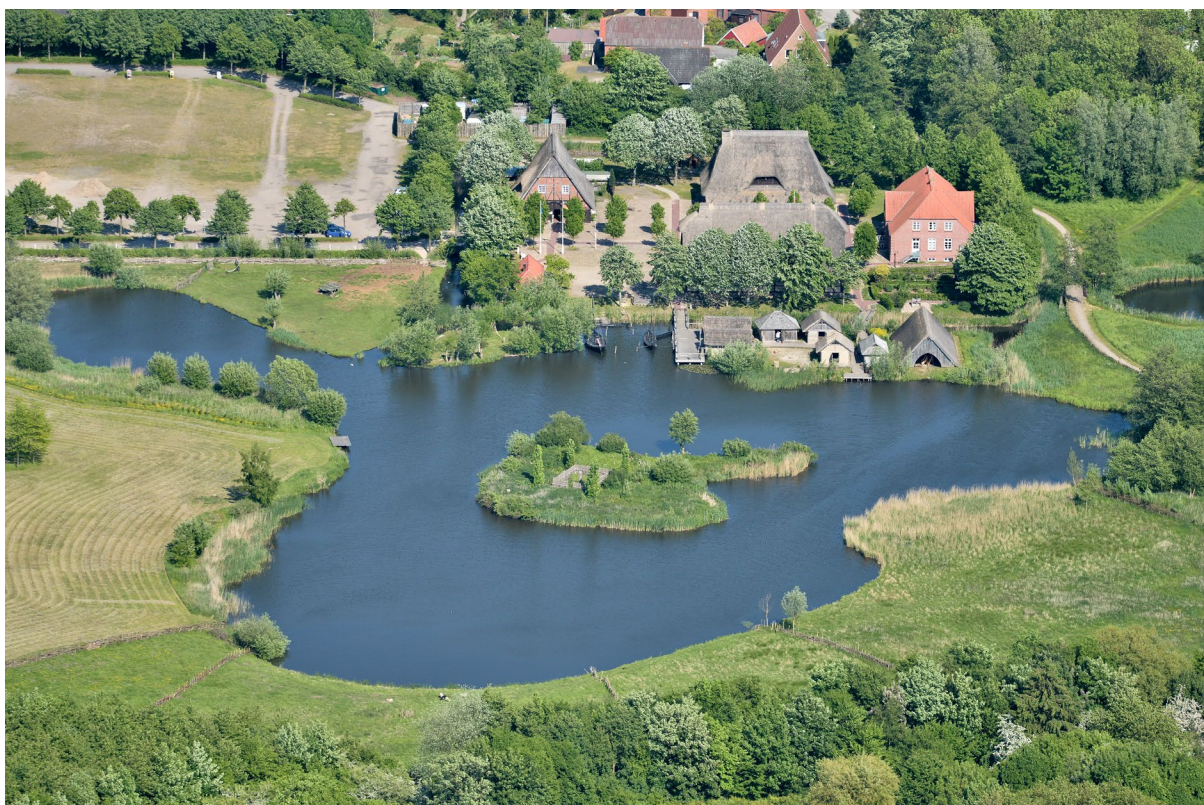
(Luftbildaufnahme vor der inzwischen erfolgten Erweiterung)